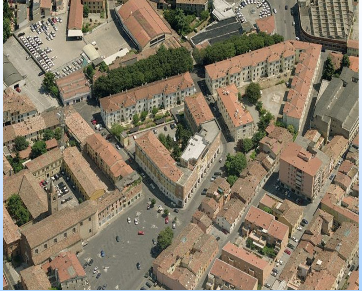
Veduta dall'alto del Centro Storico di Forlì: insediamenti di Edilizia Residenziale Pubblica

Incapacità di chiedere e offrire aiuto ai vicini anche per piccole commissioni o servizi saltuari.